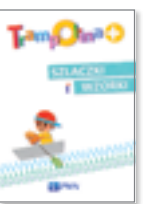
Literki • Cyferki • Czytanki • Szlaczki i wzorki