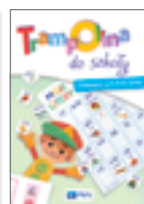
Kącik artysty • Zabawy edukacyjne