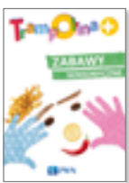
Zabawy logopedyczne Zabawy sensoryczne