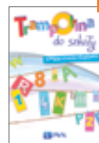
Piszę, liczę, czytam